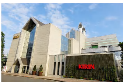
三角屋根の建物が見学の受付になります