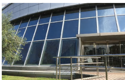
見学設備の窓に設置された薄膜太陽電池