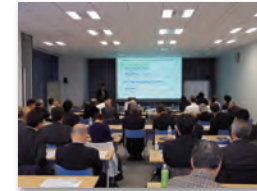
環境セミナー開催